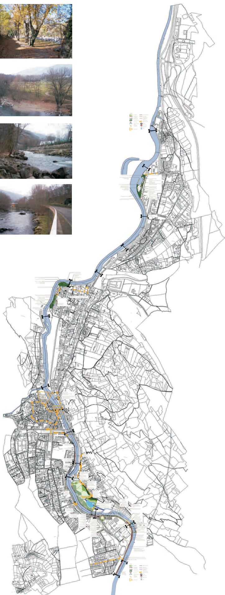
Etude de définition - Plan masse